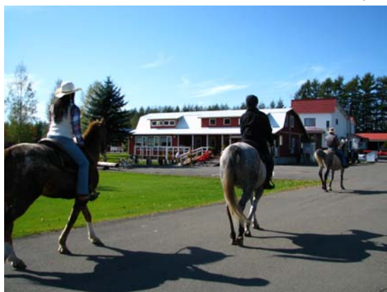
ランチタイムは鹿追町内のレストランへ(画像はカントリーパパ)